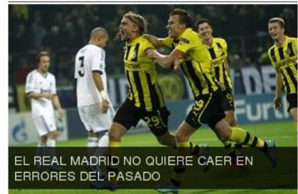
EL REAL MADRID NO QUIERE CAER EN ERRORES DEL PASADO