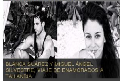
BLANCA SUÁREZ Y MIGUEL ÁNGEL SILVESTRE, VIAJE DE ENAMORADOS A TAILANDIA