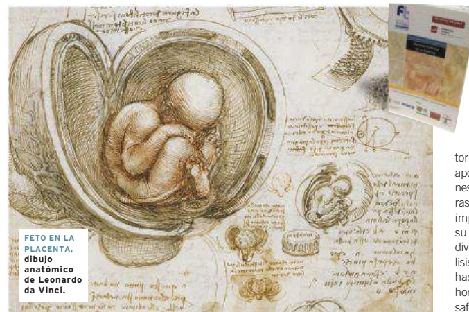
FETO EN LA PLACENTA, dibujo anatómico de Leonardo da Vinci.

de control mental, primero con prisioneros de la guerra de Corea y, después, con hombres reclutados por prostitutas de San Francisco y Nueva York. Borrachos y drogados mantenían relaciones sexuales mientras eran grabados por la CIA. ¿Se puede alegar en alguno de estos casos que se llevaron a cabo en aras a un supuesto progreso? Ahora se puede responder con rotundidad, pero no siempre se hizo. Es así desde que un reducido número de científicos, médicos e intelectuales se sentaron para dar cuenta de estos conflictos y aventurar respuestas. Algunas son ya rotundas, pero otras están en estudio. No puede ser de otra forma ante