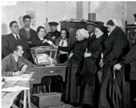
Referéndum autonómico del 5 de noviembre de 1933 en Éibar.

La leyenda principal que cae es que únicamente la izquierda se interesase por el sufragio femenino. En efecto, Manuel Azaña se había mostrado partidario de él antes del cambio